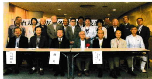
明治大学マンドリン倶楽部OB会 メモリアルオーケストラ新春コンサート