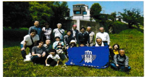
生田緑地 岡本太郎美術館見学