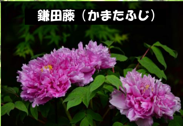
鎌田藤 (かまたふじ)

また、公園の東側に東京都が指定する「町田民権の森緑地保全地域」約19000平方メートルが広がっています。