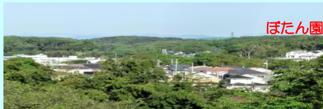
ぼたん園から北を望む