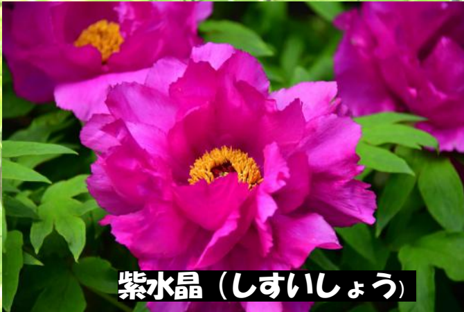
紫水晶 (しずいしょう)