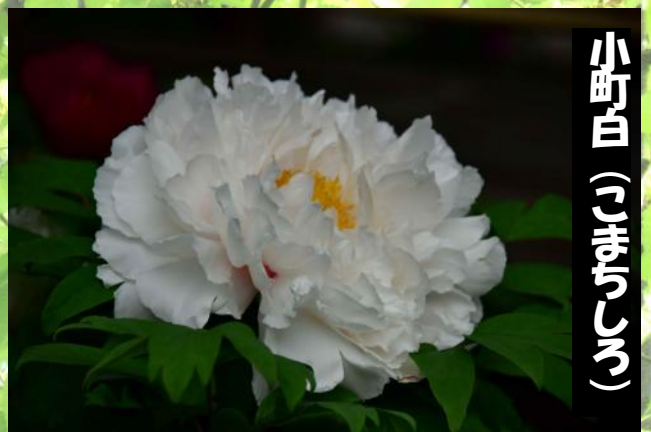
小町白 (こまちしろ)