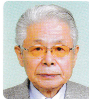
大会実行委員長 (千葉県東部支部長)