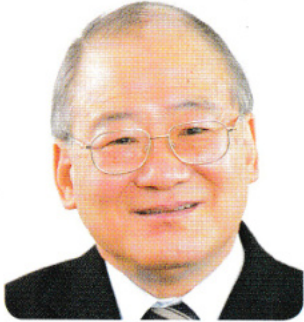
明治大学校友会 会長