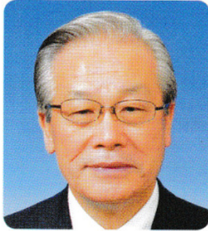
大会実行委員会会長 (千葉県西部支部長)