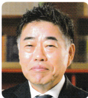
明治大学 学 長