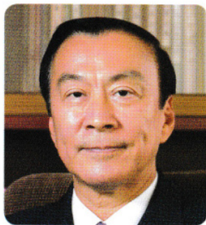
学校法人明治大学 理事長