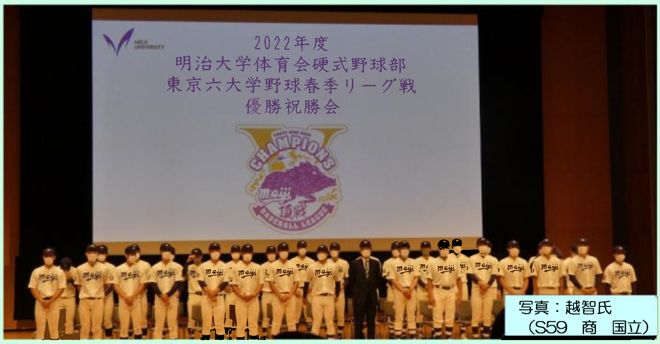
写真：越智氏 (S59 商 国立)