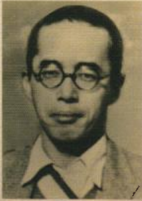
第二十七代沖縄県知事