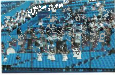
応援団の力強いエール