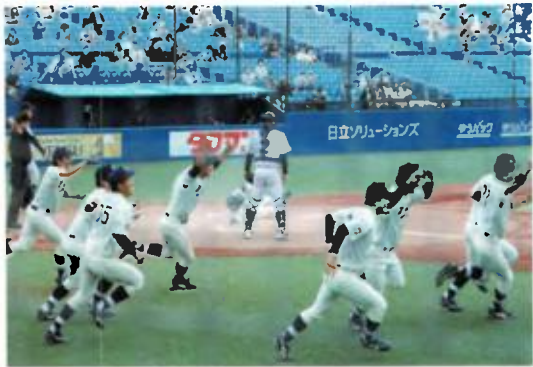
明大、延長 11 回 劇的サヨナラ勝ち！！