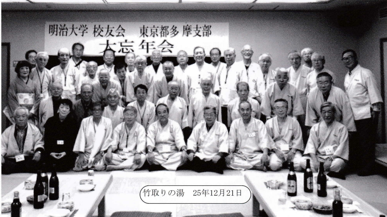
竹取りの湯 25年12月21日