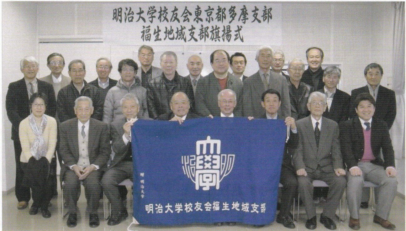
▲福生地域支部旗揚式