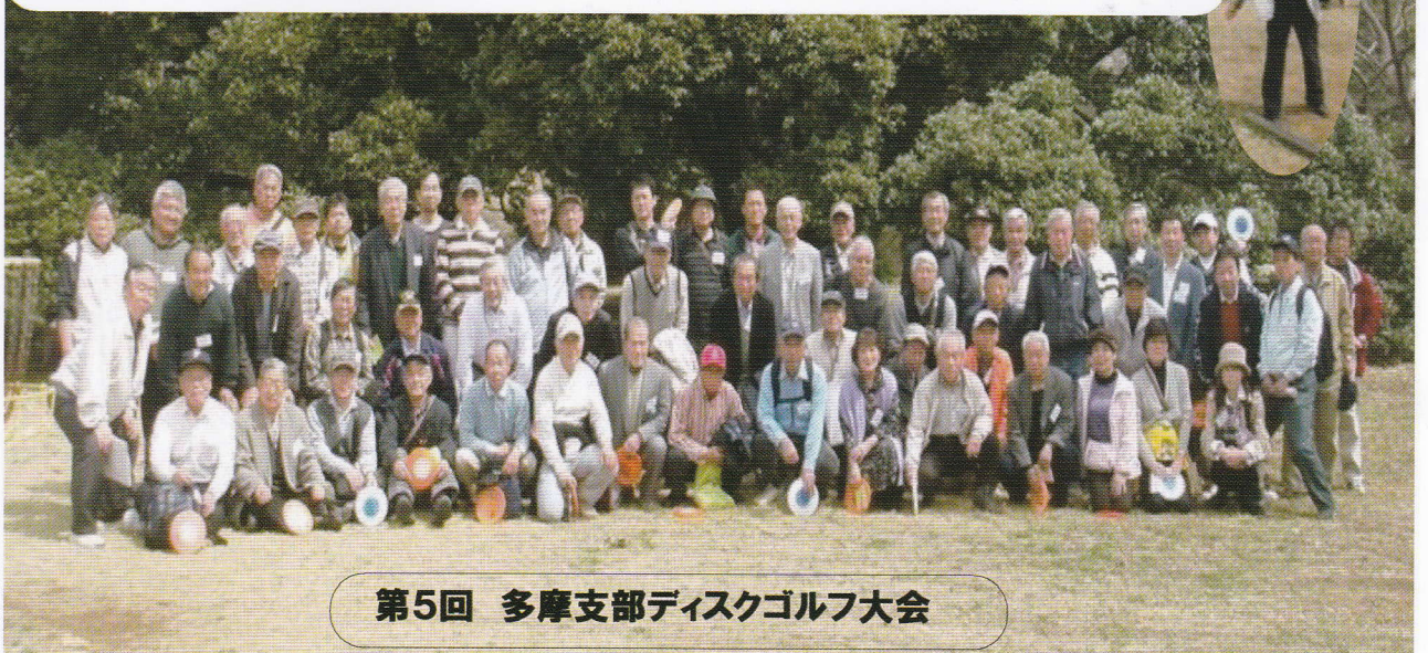
第5回 多摩支部ディスクゴルフ大会