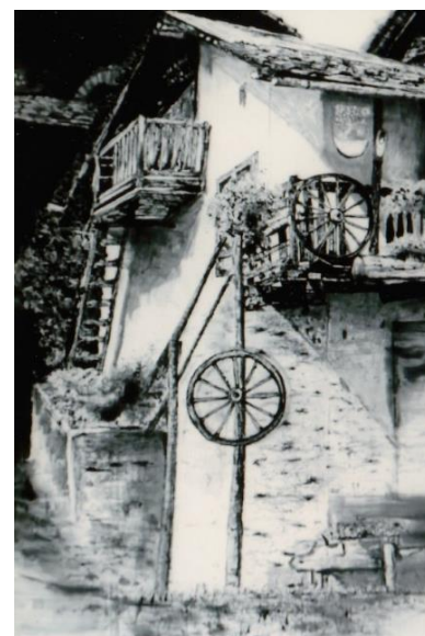
陽のあたる南イタリアの農家