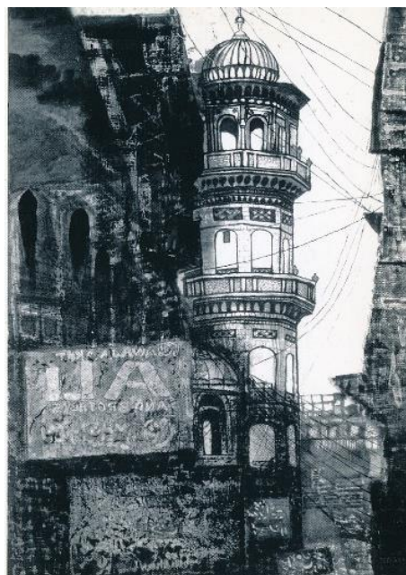
ペシャワールのモスク