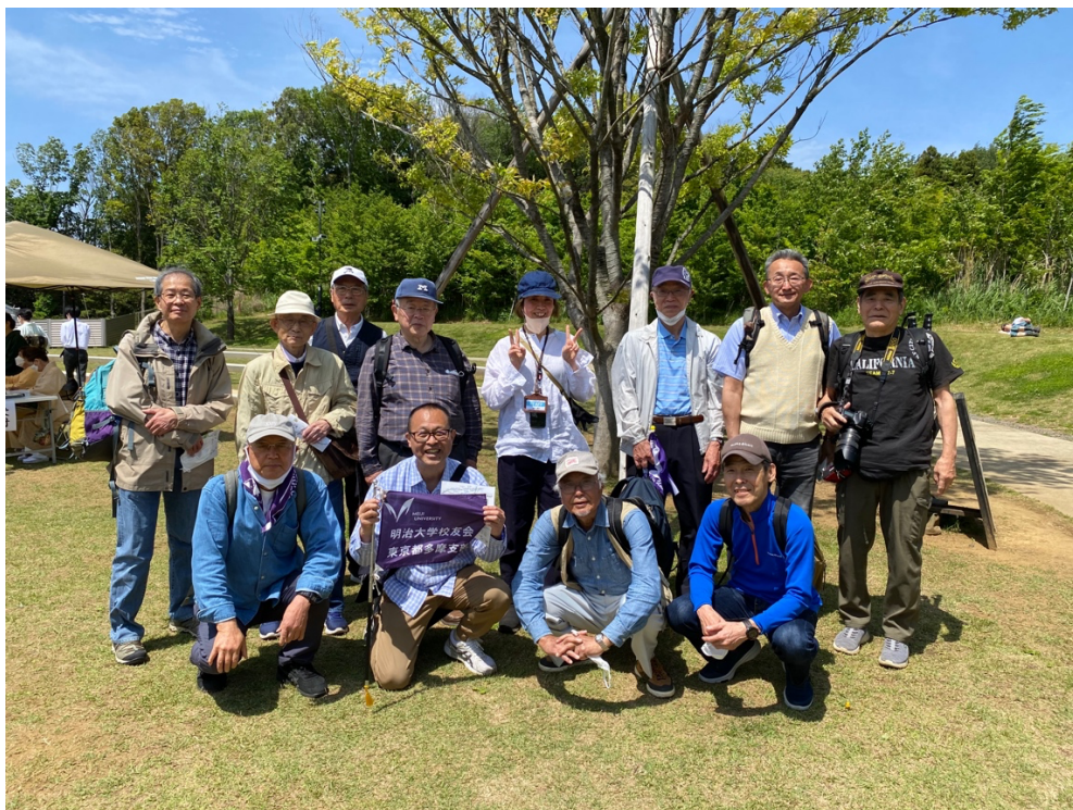
西園のお茶会イベント会場にて(真ん中のイベントスタッフが女性校友)