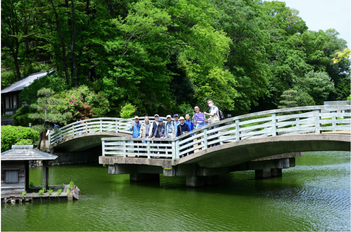
薬師池公園たいこ橋にて